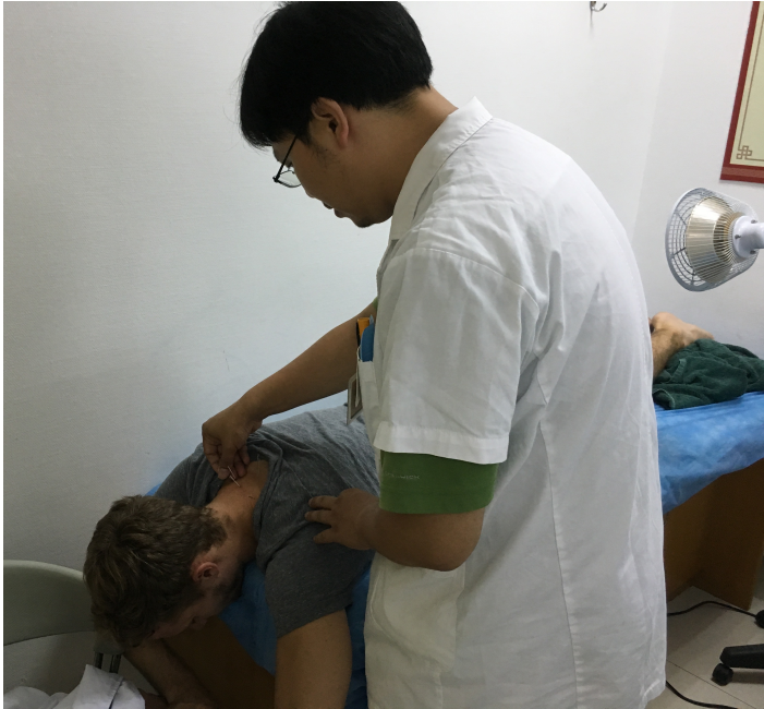
Akupunkturbehandlung an mir