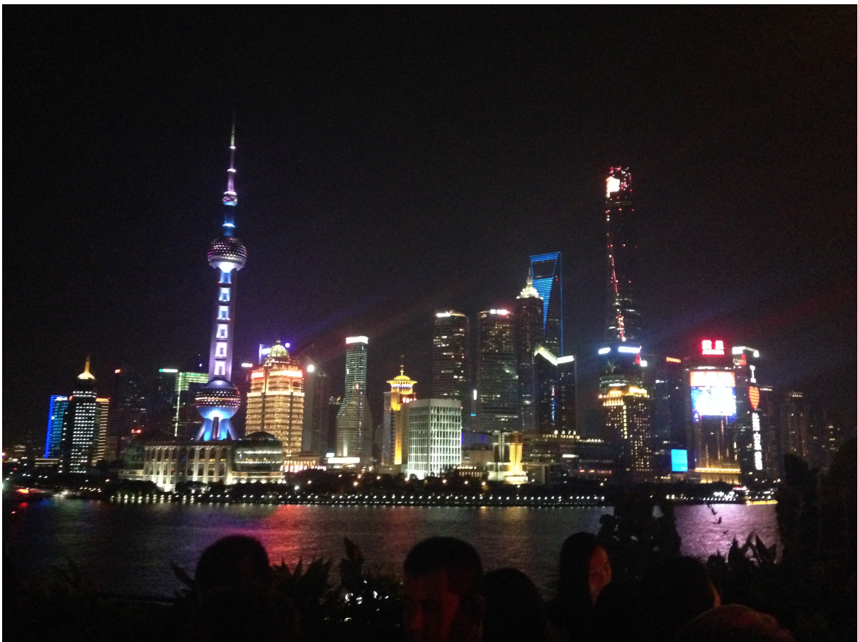
Ausblick von der Bar Rouge auf die Skyline Shanghai's